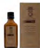
50 ml / 1.69 fl.oz #BARBA ITALIANA Romolo Olio per barba e pre rasatura Beard and pre-shaving oil