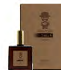
100 ml / 3.38 fl.oz #BARBA ITALIANA Stringiti a Me Eau de toilette Eau de toilette