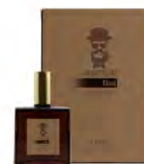
100 ml / 3.38 fl.oz #BARBA ITALIANA Rimani Eau de toilette Eau de toilette