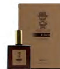
100 ml / 3.38 fl.oz #BARBA ITALIANA Un Ricordo Eau de toilette Eau de toilette