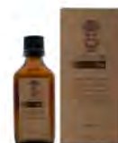
50 ml / 1.69 fl.oz #BARBA ITALIANA Remo Olio per barba e pre rasatura Beard and pre-shaving oil