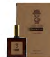
100 ml / 3.38 fl.oz #BARBA ITALIANA Pastori d'Abruzzo Eau de toilette Eau de toilette