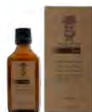
50 ml / 1.69 fl.oz #BARBA ITALIANA Tiziano Olio per barba e pre rasatura Beard and pre-shaving oil